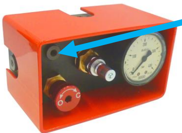
Control Panel (example) Pannello di controllo (esempio)

Unscrew connection port plug and screw in valve. Svitare il tappo del foro di collegamento e avvitare la valvola.