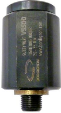
(model VS500 is shown) (è mostrato il modello VS500)

VALVE BODY: WRENCH 24 mm CORPO VALVOLA: CHIAVE 24 mm